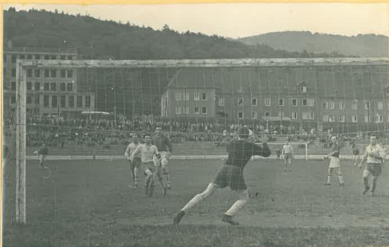
Brankář hostí kryje střelu Hrušky - v pozadí přihlíší Franěk

Záběry z I. poloviny mistr. zápasu TJ Šz - Sl. Varnsdorf :