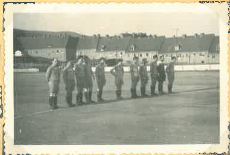
Foto snímky pocházejí ze stadionu SZ a přítelstvi s hráči přátelského utkání

V neděli je na pořadu VI. kolo: Baník Ervénice—PDA Litoměřice, Baník Duchcov—Baník Most, Baník Kopisty—Baník Děčín, Slavoj Litoměřice—Slavoj Roudnice, Jiskra Litvínov SZ—Baník Chomutov. Odloženo je utkání Spartak Ústí n. L.—Spartak Teplice. Somet, volno má RH Ústí n. L. V hořejší tabulce je započítán kontumační výsledek Spartak Ústí n. L.—Jiskra Litvínov SZ 3:0.