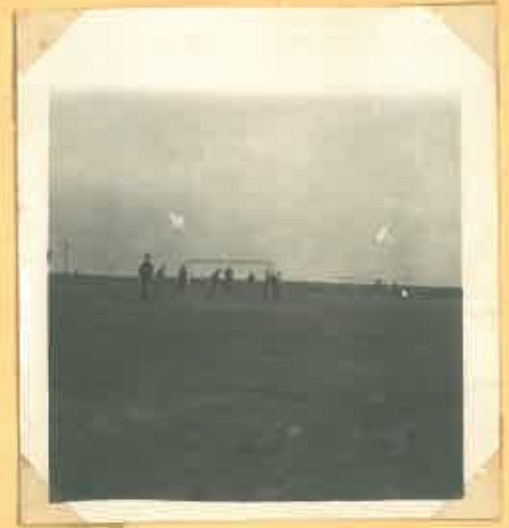
Z jara je krátký den a proto je třeba trénovat až do soumraku.