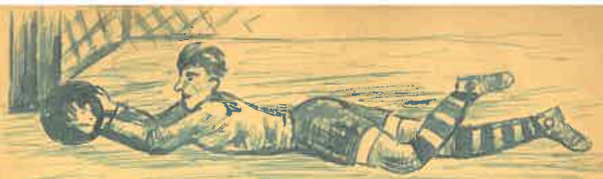
Branář B mužstva Doležal, ✓ při tréninku.